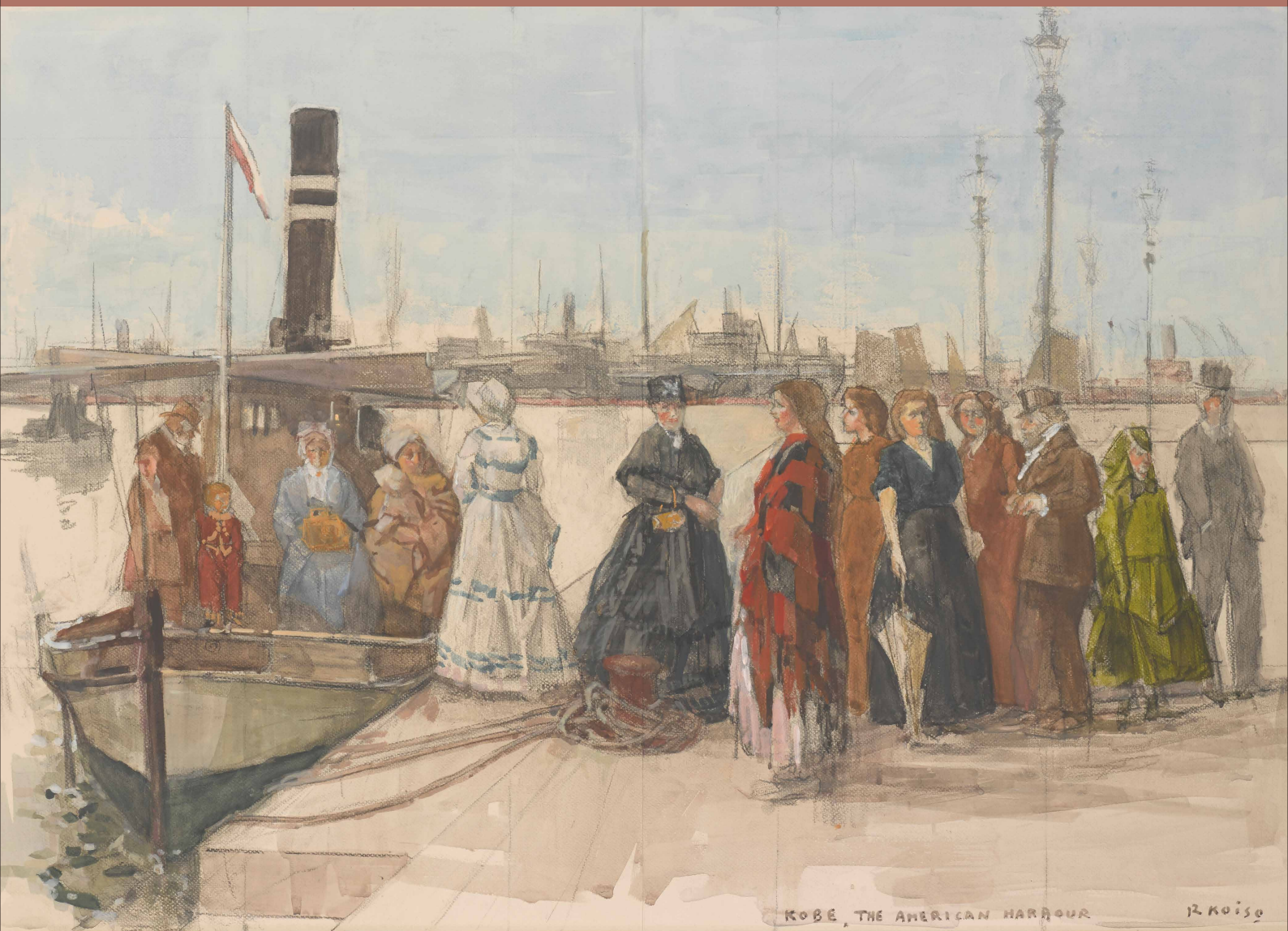
小磯良平「KOBE, THE AMERICAN HARBOUR」