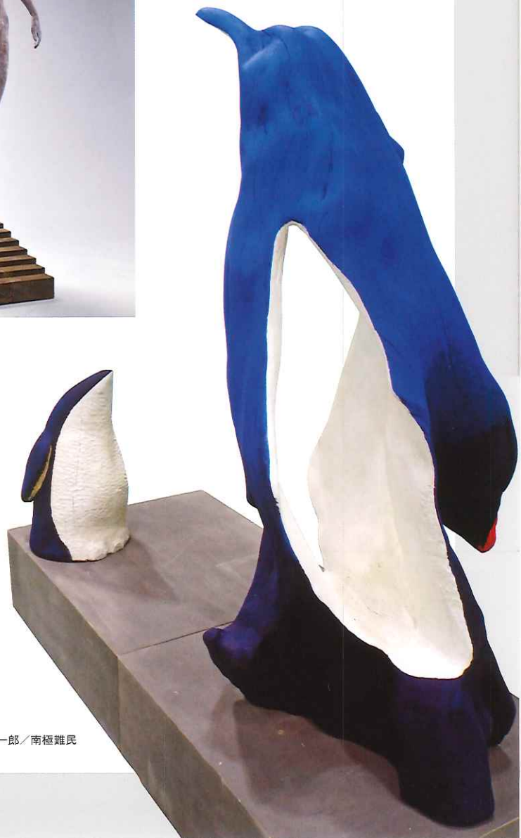
秦榮一郎/南極難民